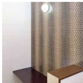
▲中二階にはスタディーコーナー