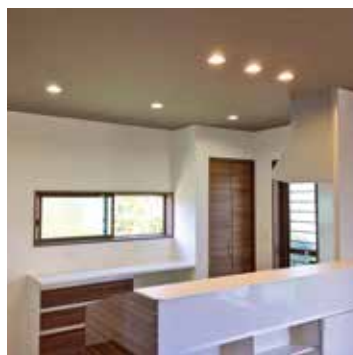
▲使い勝手のよい家事動線